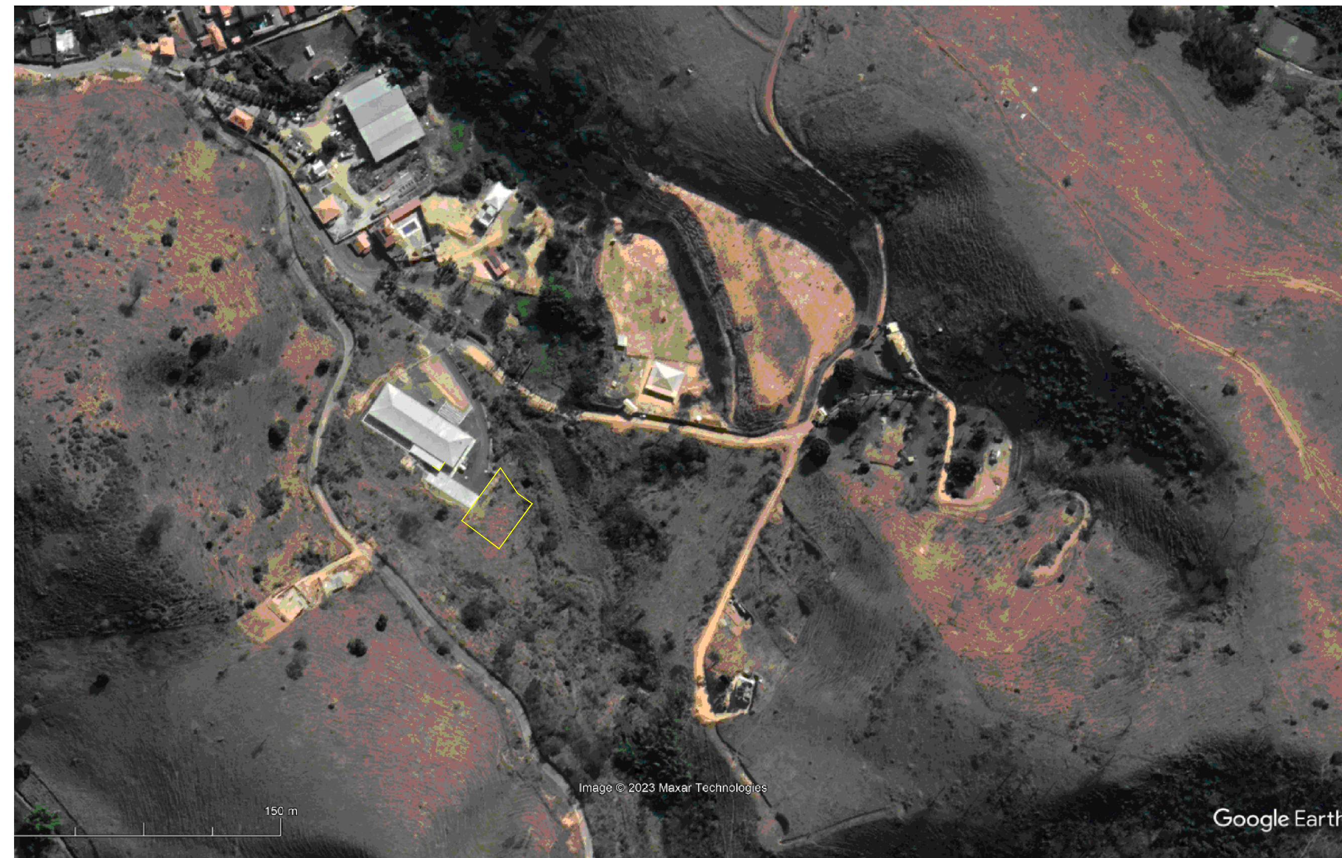
PLANTA LOCALIZAÇÃO ESC.: 1/2.000

QUADRO DE ÁREAS: ÁREA DO LOTE/PLATO = 824,68m²; VOLUME DE CORTE = 311,95 + 25% = 389,94m³; VOLUME DE ATERRO = 311,95 + 25% = 389,94m³; OBS.: NÃO HAVERÁ BOTA FORA.